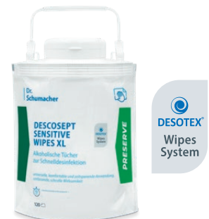
DESCOSEPT SENSITIVE WIPES XL