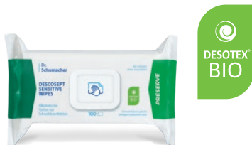
DESCOSEPT SENSITIVE WIPES