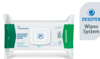
DESCOSEPT SENSITIVE WIPES